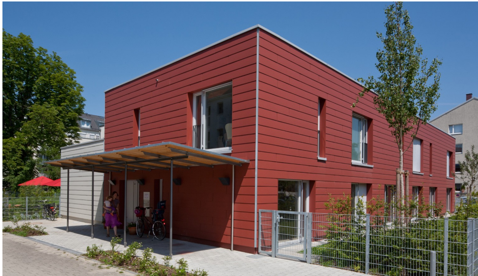
Ansicht von Südwesten

Baureferat Referat für Bildung und Sport