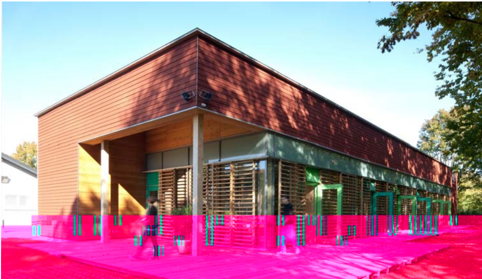
Ansicht von Südwesten